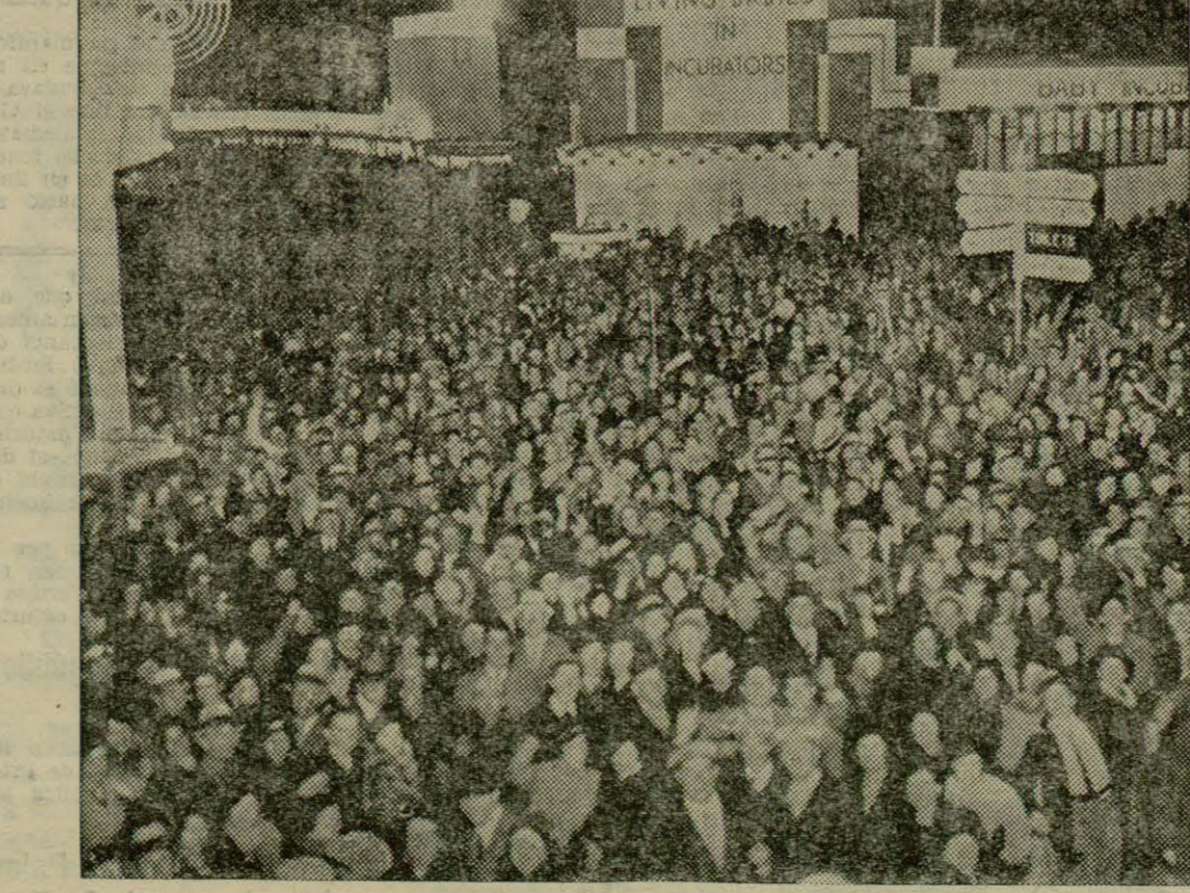
Un immensa gornació celebrà la clausura de l'exposició de Xicago, anomenada «Un segle de progrés», dins d'una gran animació que acabà amb un veritable saqueig de diversos edificis. La nostra fotografia dona una idea de la formidable gornada que hi assistí