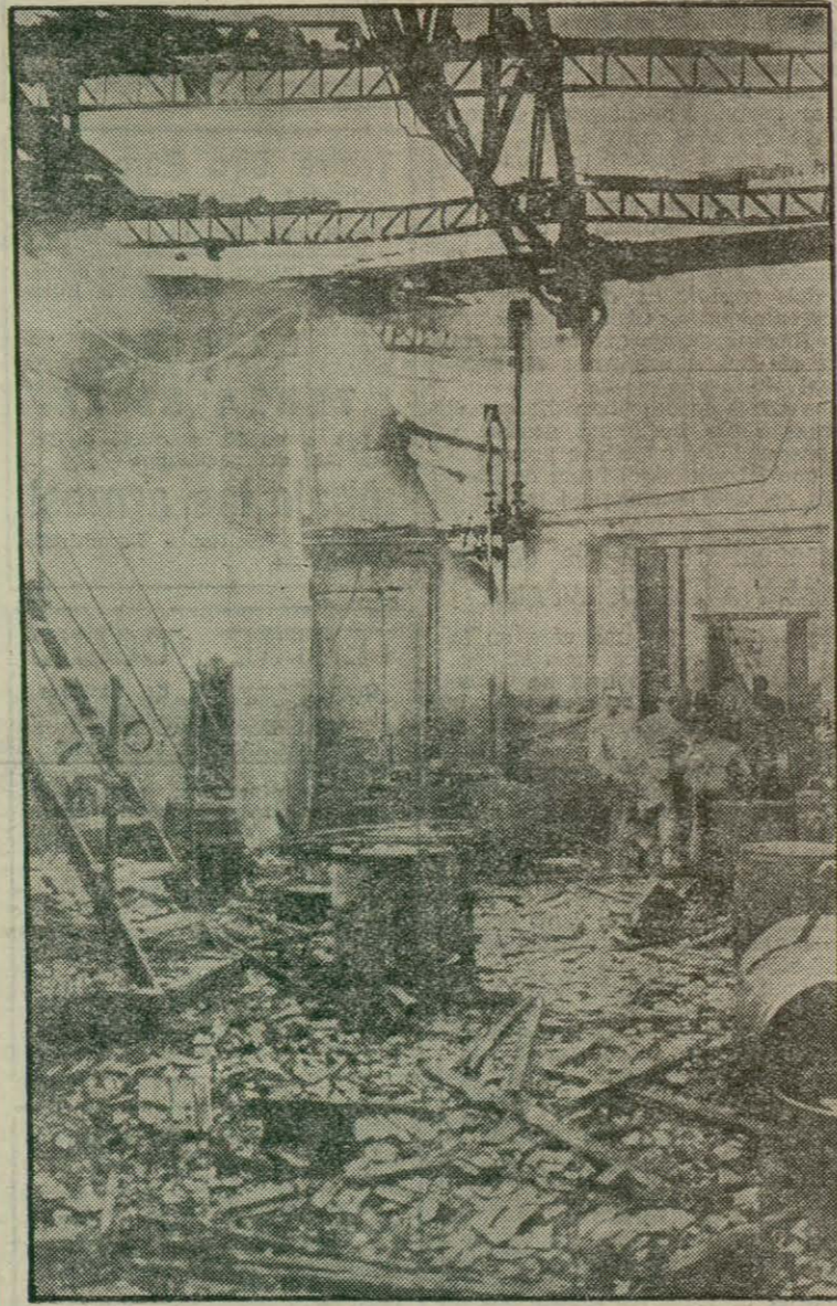
Interior de la fàbrica d'olis minerals de la Companyia Auxillar del Comerç i de l'Indústria de Badalona que resultà destruïda a conseqüència d'un foc declarat abans d'ahir, incendi que es creu produït per un curt circuit