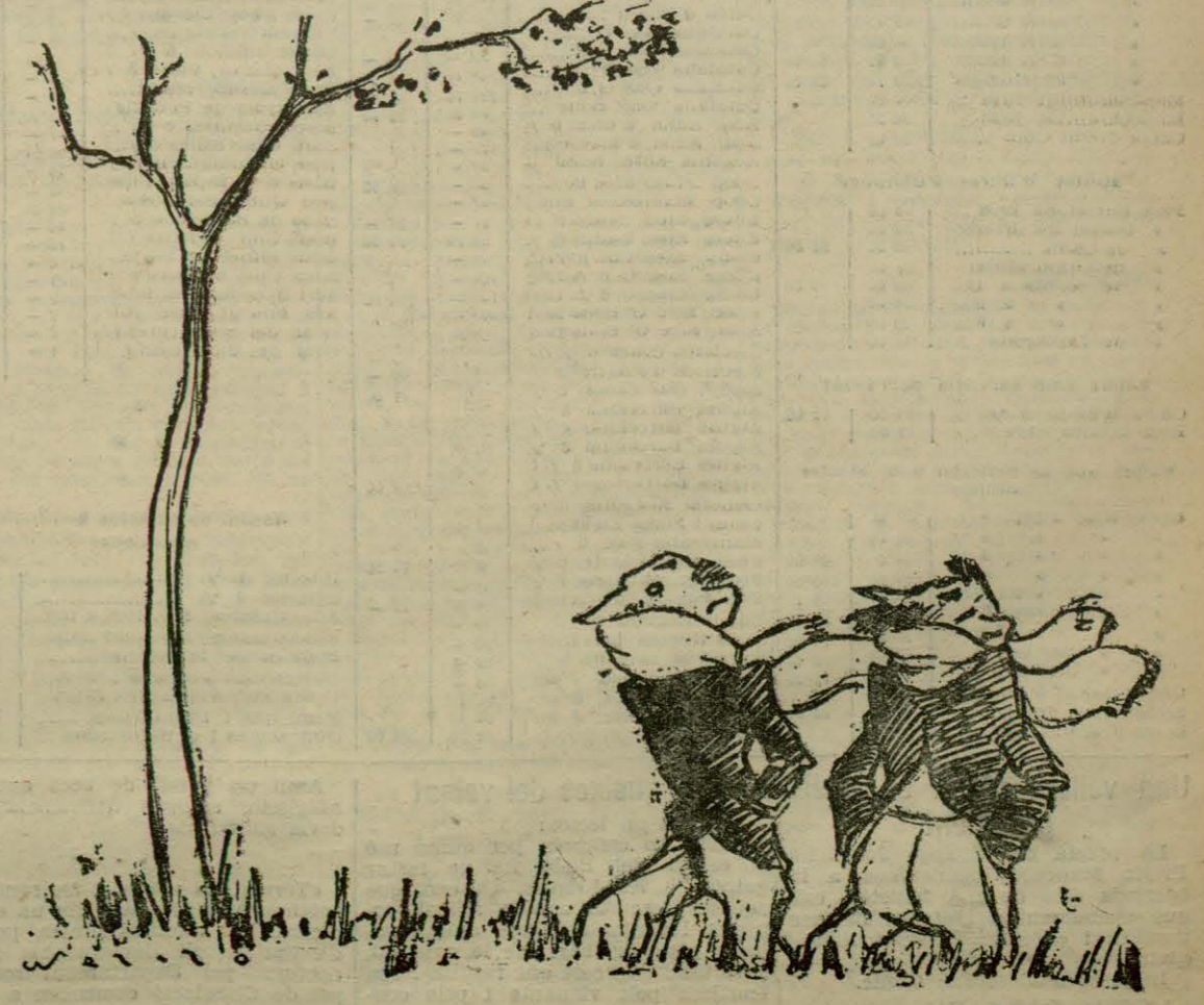
— Anem a caçar nius? — No, home! Això a la Primavera...

El señor Blum cita después la siguiente frase de Chateaubriand, cuando era ministro de la Monarquía legítima: «No renunciemos jamás al privilegio que nos viene de nuestros antepasados. Cualquiera que llegue a tierra francesa es libre y disfrutará de los beneficios de una inviolable hospitalidad.» Y el artículo termina preguntando si la República francesa pasará por la vergüenza de renunciar al glorioso privilegio que la Monarquía reivindicó con orgullo.»