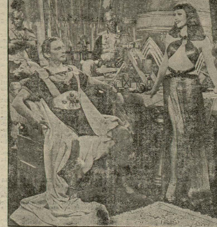
Una escena de «Cleopatra»

amb Potinos al cap, aconseguiren imposar-se al govern d'Egipte, i per tal d'acabar amb el poder del poble i no oferir a Juli Cèsar, que estava a punt d'arribar a Alexandria, una altra alternativa que la de sancionar la seva causa, conceberen la infame idea de treure del mig a la gent de la ciutat.