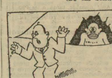
«AMENAZA...» (De «El Liberal».)