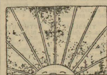
«DIBUJO DE ALMOHADON...» (De «El Sol».)