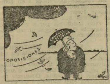
«SE APROXIMA LA BORRASCAS...» (De «La Libertad».)