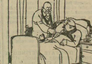
«FRUTA DEL TIEMPO...» (De «La Voz».)