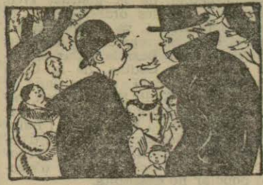
«IDEAS MONARQUICOGENIALES...» (De «Heraldo».)