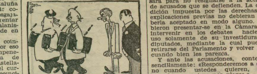
LA ÚLTIMA CRISIS. Dos con y dos sin tringueras o aquí no hay igualdad ni fraternidad. (De «Heraldo»)