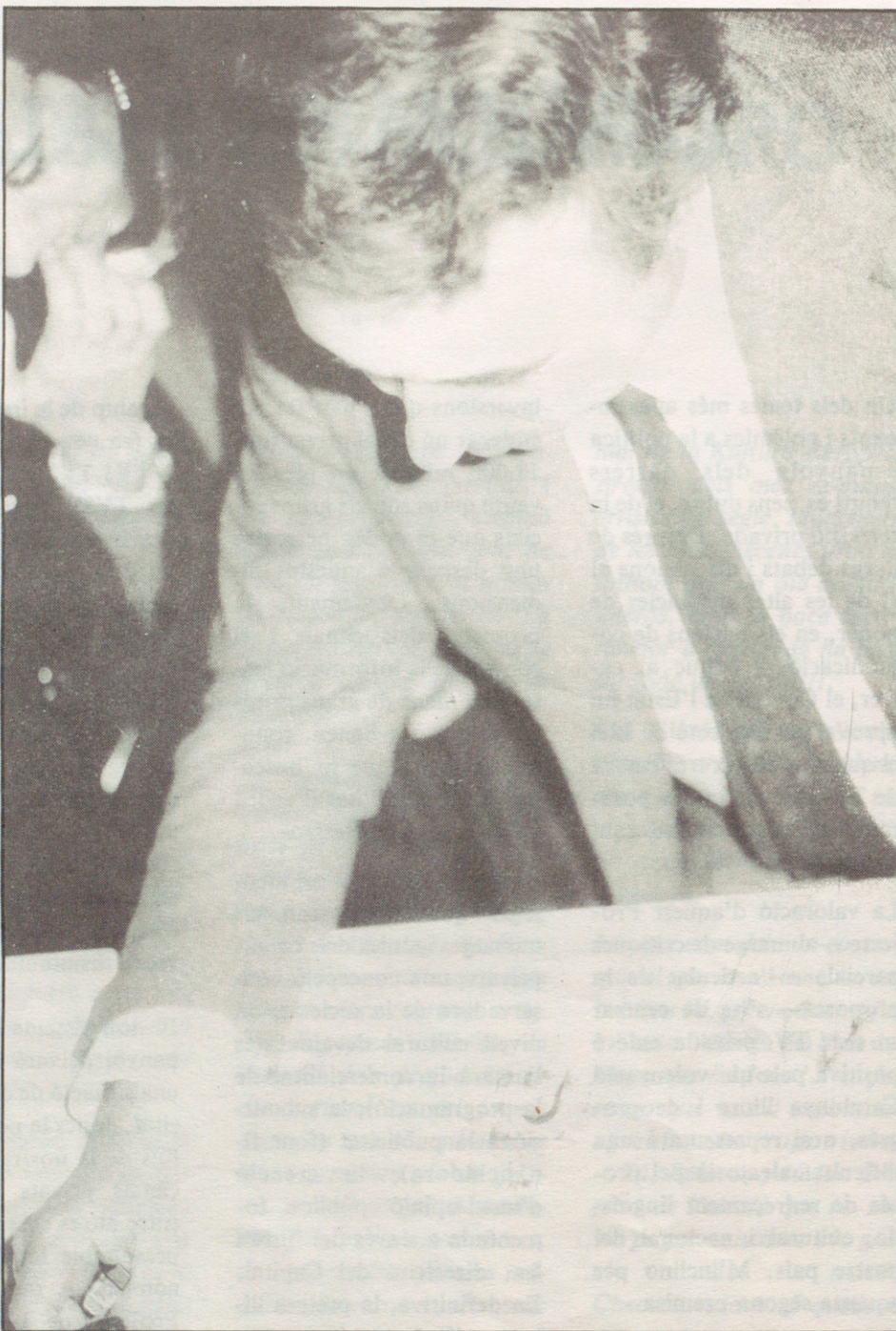
“...examinant una maqueta de LA COCTELERA”

El meu tarannà llibertari m'inclina a valorar l'individu per sobre de l'Estat. Li dono molta importància a la persona i a les seves capacitats.