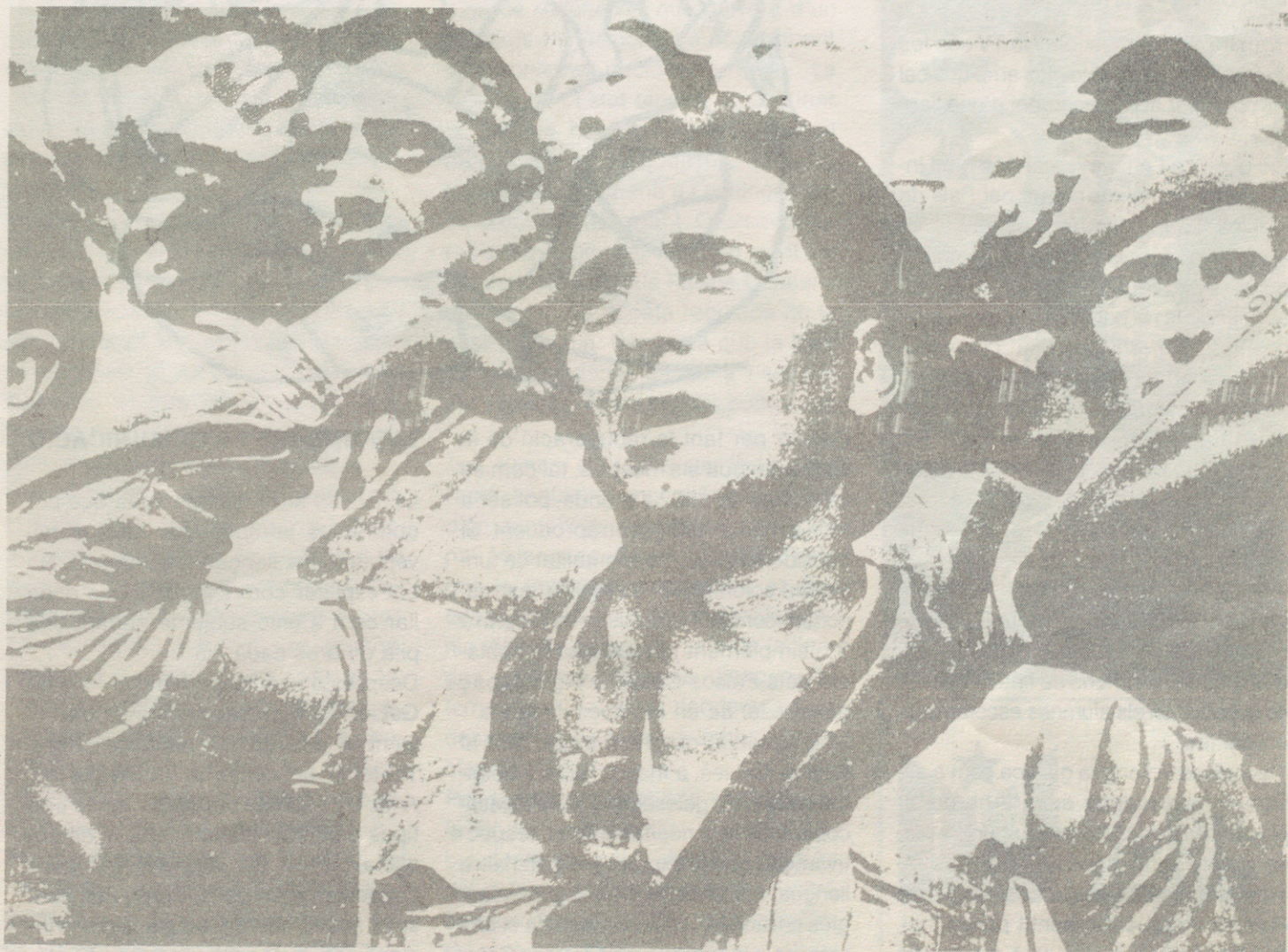
BRIGADES INTERNACIONALS