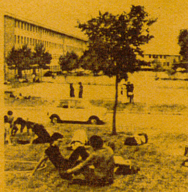
El Liceu Renouvier seu de la UCE