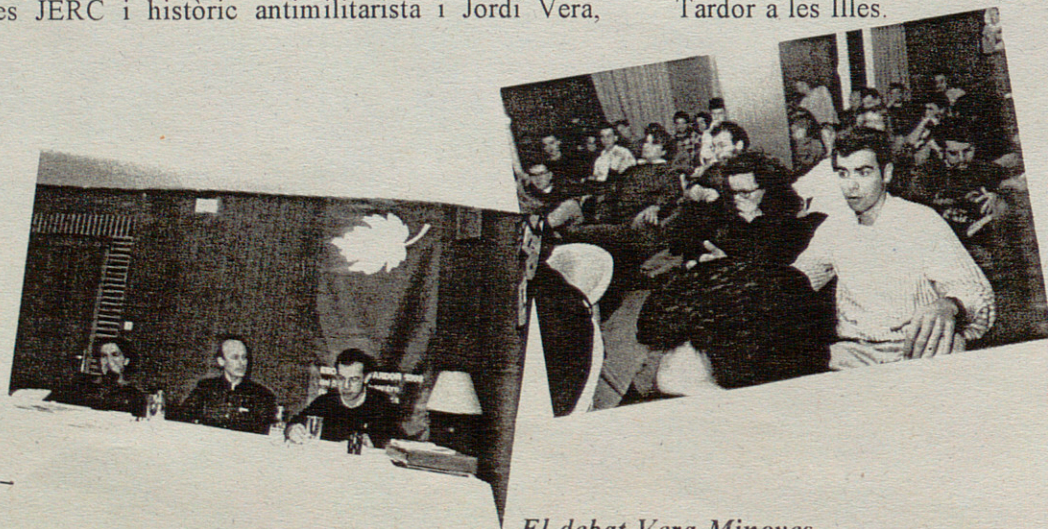
Vista panoràmica del públic assistent