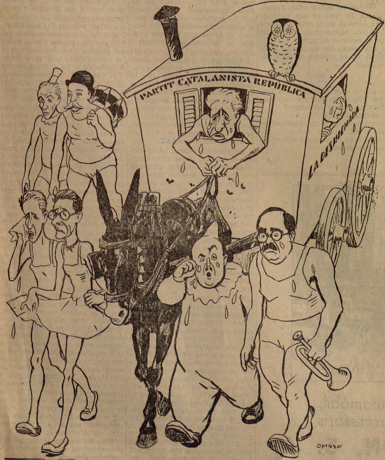
L'alegria que passa...