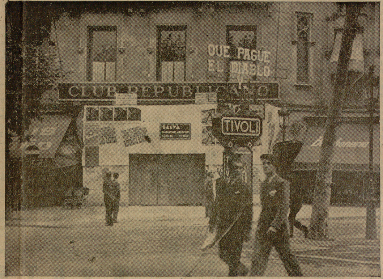
Heus ací la façana del "Club Republicano", d'aquest "club republicano" on hi són més ben rebuts els Sedó i Mas Bagà de 1932 que els radicals de 1909; aquest "Club Republicano" tan visitat els passats dies d'eleccions pels quaranta diputats radicals que havien vingut de Madrid a fer propaganda i s'estatjaven al Ritz.

Ja n'hi ha prou! Fora campanes! Es un abús intolerable el d'aquests sagristans que, a les cinc del matí, comencen a fer de "sereno" i desperten, amb el seu tocar campanes escandalós, a desvetllar el veïnat, la majoria del qual té necessitat d'aprofitar les hores dedicades al descans. És un abús, aquest de les campanes, que la República, que és de treballadors segons la seva Constitució, no pot permetre que segueixi. Si els desvagats de la clerecía es creuen amb el dret — que ningú no els dona — de molestar els ciutadans que per desgràcia seva viuen prop de les "fàbriques de parenostres", tocant campanes amb energia digna d'ésser emprada amb altres afers més profitosos per a la societat, les autoritats no deuen permetre-ho. No deuen permetre-ho, perquè durant la nit no es permeten els sorolls, i les cinc del matí, encara que els senyors capellans creguin una altra cosa, és nit per als treballadors. Aquest impunitisme es deu acabar. I esperem que les autoritats ho acabaran.