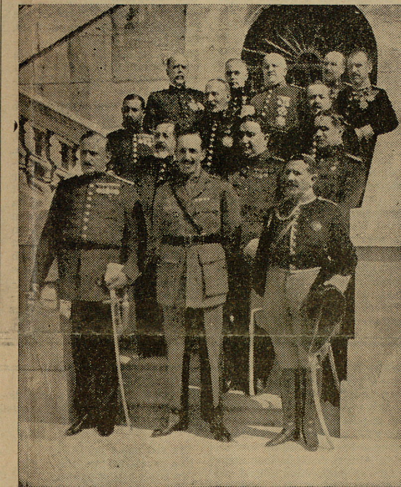
Heus ací un grup d'assistents a l'àpat d'homenatge. Assistents, encara que semblin generals.

Hi han alguns castellanismes, però això tractant-se de la Lliga no ha d'estranyar-nos: deu ésser per la concòrdia.