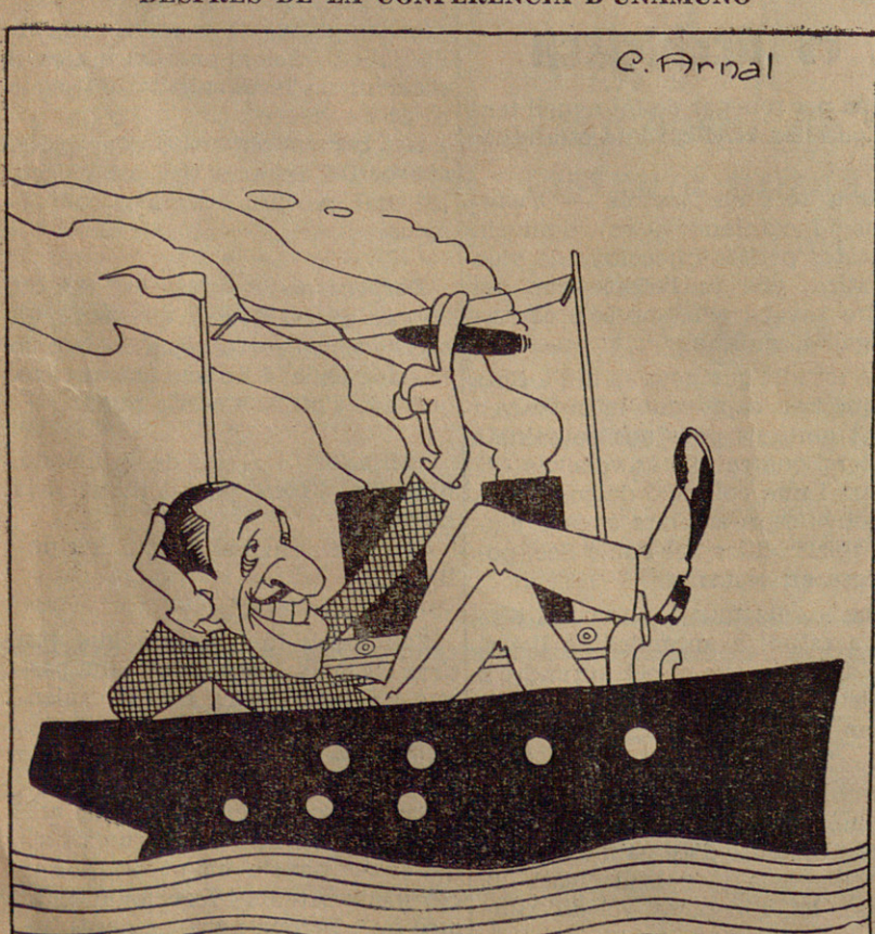
—Sempre ho havia dit que aquest Unamuno era un bon noi. Li hauré d'escriure que es passi a la Lliga.