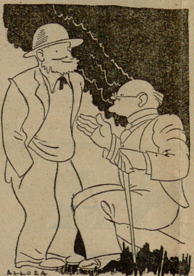
—El Lerroux perquè aquest any, senyor Sagarra, tornarà a guanyar el "Premi Ignasi Iglésies".

Pistons, en lèxic "caló", són "andoles" i "beales", per ells.