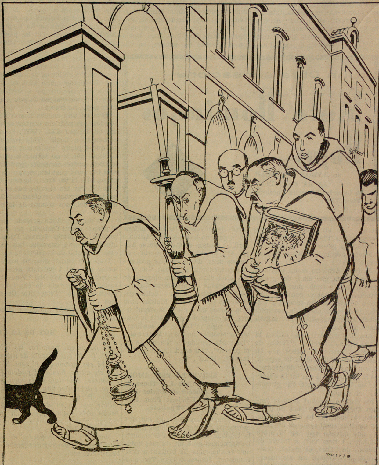
COM ES PRESENTAREN AL PARLAMENT CATALA ELS DIPUTATS DE LA LLIGA.

—No en feu cas d'aquests ateus, fills meus; doneu-nos els vostres diners, i nosaltres us donarem la pobresa, que és la major virtut!