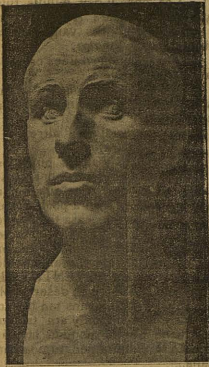
AUTO-BUST per J. Adsuara

Posém un eixemple: dos que estudien una mateixa carrera, en llibres dels mateixos autors, ab iguals cursos y que demprés, cada hu d'ells te una manera diferent d'interpretar y eigerxir la seua; sent la dels dos la mateixa.