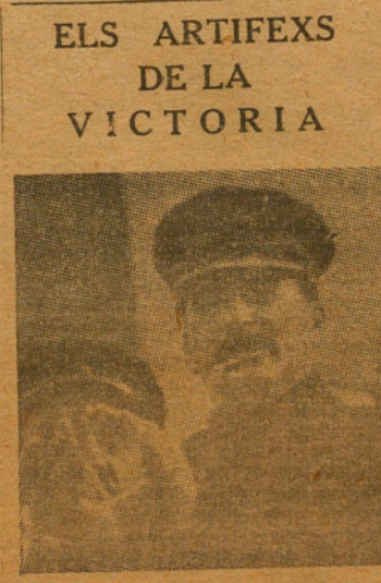
ELS ARTIFEXS DE LA VICTORIA