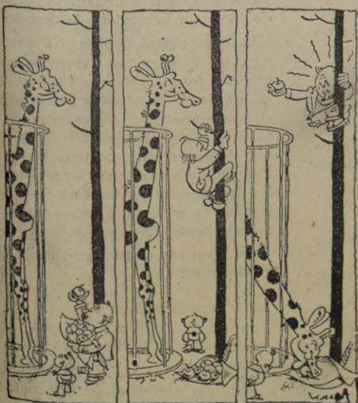
LA GIRAFETA ESTUPIDA