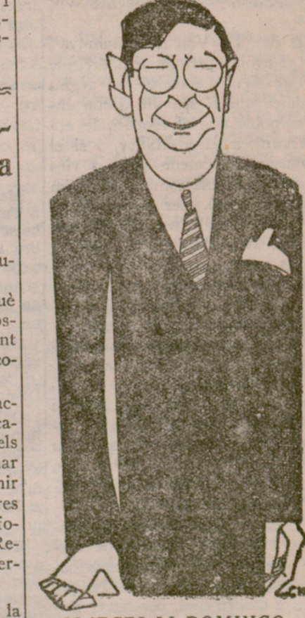
MARCELLÍ DOMINGO Ministre d'Instrucció Pública, membre del Directori d'Esquerra Republicana de Catalunya. El decret que acaba de publicar facilitant la Generalitat per crear una normal mixta i la conferència que ha de pronunciar avui a Tarragona, fan actual, una vegada més, aquesta figura estimada dels catalans

El periòdic "Ara", de Palafrugell, denuncia: "La rigorosa vigilància de què són objecte des de fa dies les nostres costes, ha cridat fortament l'atenció i és objecte de molts comentaris. Mentre uns suposen que es tracta de sorprendre un desembarcament de tabac de contraban, els més alarmistes creuen endevinar que el desembarcament ha de tenir un contingut més bèl·lic; no res menys que armament destinat a fomentar les agitacions contra la República que hom intenta en diversos llocs de la península. No és feina nostra investigar la certitud o la falsedat de les veus volants. El que sí podem afirmar és que cada nit un vaixell de l'Armada navega per aquestes aigües encarrant al llarg de la costa els seus reflectors i que el cos de carrablers deté sovint els peatons i vehicles que troba pels camins que aconduïxen al litoral, especialment a Tamariu i Aigua Gelida."