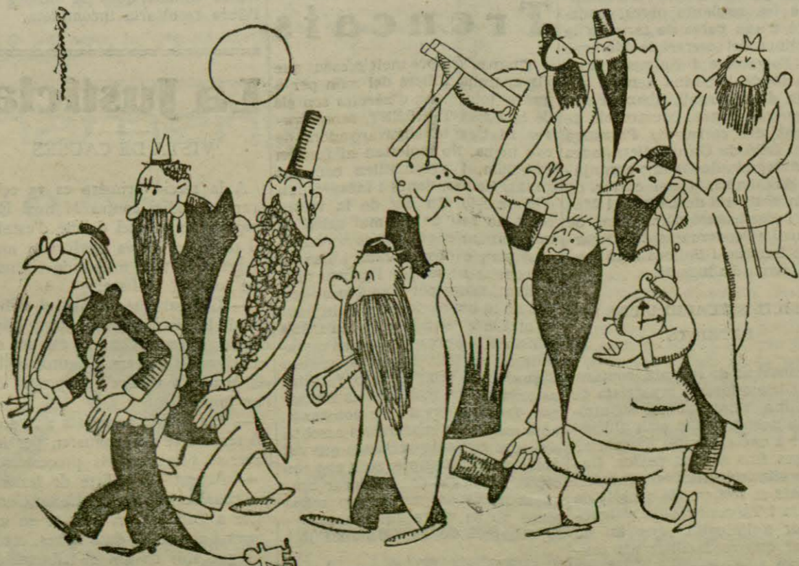
Els parlamentaris de la República sortint d'una sessió permanent.