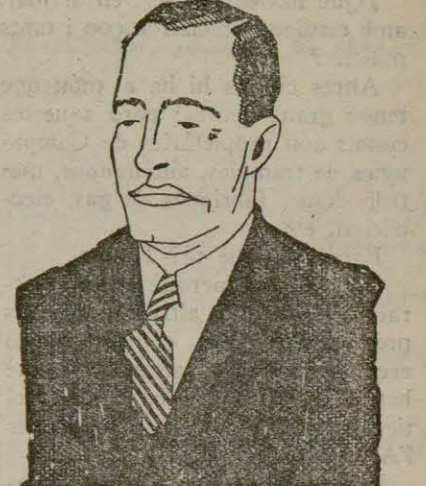
El diputat JOSEP TARRADELLAS

omplia la sala, tingué de parlar el senyor Companys, que entusiàsmat l'auditori, i després haguéren de parlar, també, l'alcalde Dr. Agudé, que amb tinent d'alcalde senyor Ventós, rribà en aquell moment de