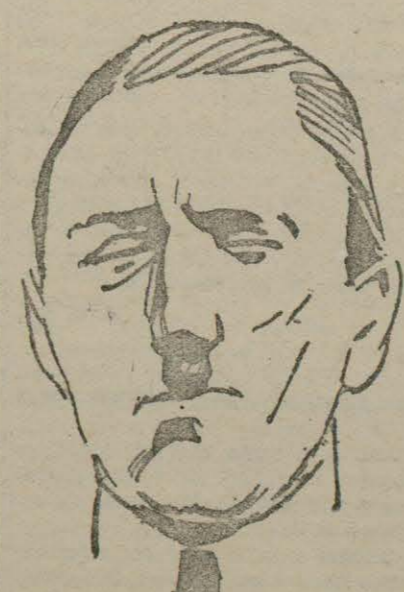
EL CANDIDAT THAELMANN

En efecte, en aquestes darreres 48 hores s'ha observat que mentre les cartelleries públiques han desaparegut sota milers de fulles i dibuixes a favor d'Hindenburg, a penes si se'n veuen d'Hitler i dels comunistes.