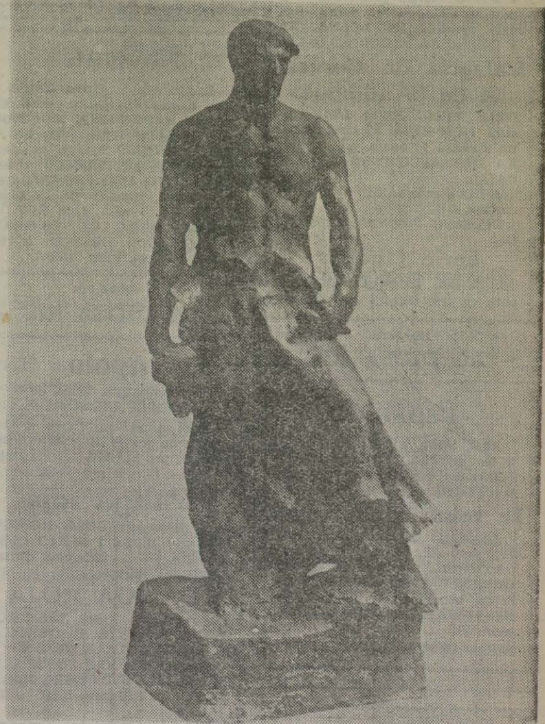
El Treball, l'escultura de Josep Llimona als jardins de Montjuïc.

Amò motiu de la Festa del Treball, la Comissió de Cultura de l'Ajuntament i el Patronat Escolar de Barcelona, ofereixen als alumnes de les Escoles Municipals i dels Grups Escolars de la Ciutat un bell recordatori, consistent en una reproducció de l'escultura de Josep Llimona — reproduïda també per nosaltres — tirada en paper "couché", al peu del qual hi han estampades aquestes paraules de Jules Payot: