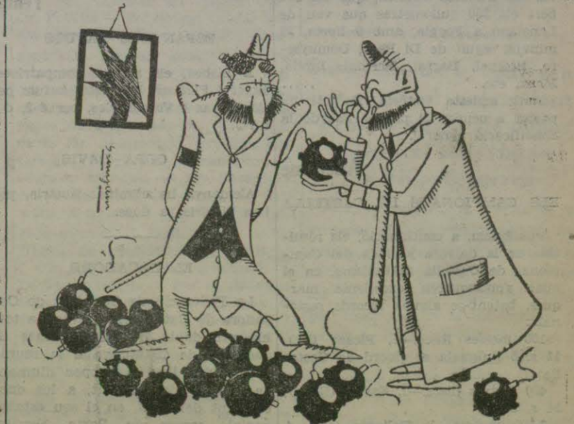
EL TRAFIC DE BOMBES

ta anys, amb les seves meravelloses novel·les d'imaginació, plenes de saludable intenció social. Des del principi va posar la seva fama i la seva art al servei de la consciència d'unitat mundial, que ell contribuïa a crear. A part de la seva obra més estrictament literària, Mr. Wells ha fet diversos grans serveis a la humanitat, entre els quals cal comptar la publicació de L'Esquema de la Història, La Ciència de la Vida i El treball, la riquesa i la felicitat de la humanitat. Aquest escriptor anglès és un dels homes que lluiten amb més èxit contra els egoïsmes nacionals i a favor de l'entesa de tots els homes de bona voluntat. Esperem que podrà establir a casa nostra els contactes que calen per a dur-se'n la impressió que correspon al veritable esperit de Catalunya.