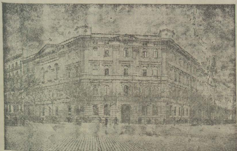
ANTIC COLLEGI DELS JESUITES AL CARRER DE CASP, AVUI GRUP ESCOLAR DE L'AJUNTAMENT DE BARCELONA, ON REBEN INSTRUCCIO 1,213 INFANTS DELS DOS SEXES

Sense donar sortida a la passió que embruteix el poble, sense demagogia, sense perdre el control de nosaltres mateixos, amb la certitud que la victòria és nostra.