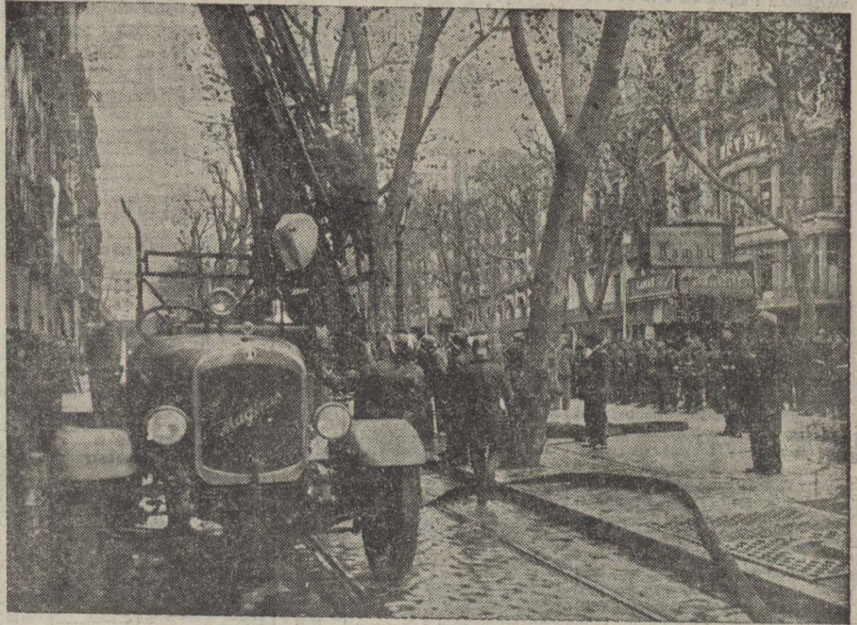
EL SERVEI D'EXTINCIO FUNCIONA AMB LA MAXIMA RAPIDESA I EFICACIA. — ELS BOMBERS ESCALANT L'EDIFICI

Llegiu a les pàgines centrals l'extensa informació de l'incendi