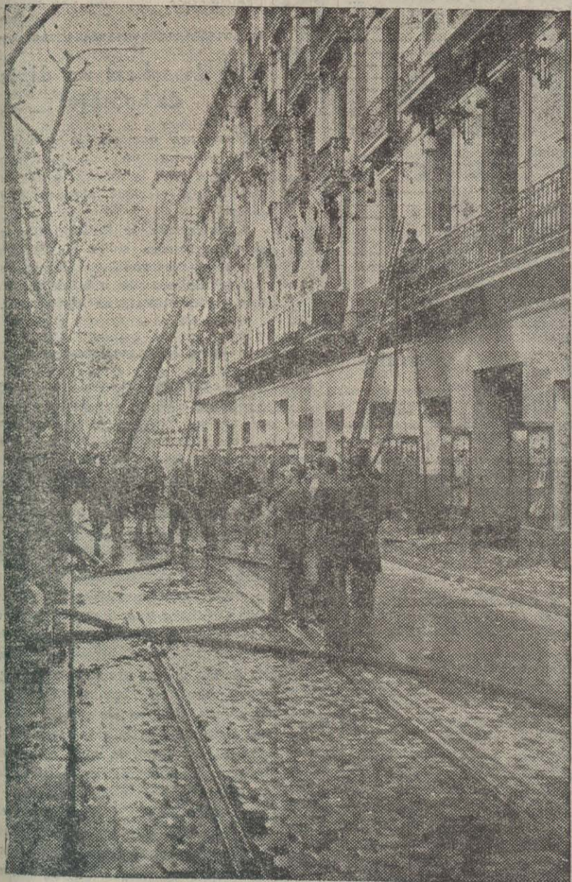
ELS BOMBERS EN PLENA ACTUACIO

L'EFICACISSIMA INTERVENCO DEL COS DE BOMBERS IMPEDI QUE EL FOC ES PROPAGUES ALS EDIFICIS VEINS, I LLUR CONDUCTA FOU DIGNA DE LA COOPERACIO QUE ELS CIUTADANS PRESTAREN ALS TREBALLS D'EXTINCIO. — SET FERITS. — LES AUTORITATS, AMB EL PRESIDENT MACIA AL DAVANT, ACUDIREN AL LLOC DEL SINISTRE DES DELS PRIMERS MOMENTS