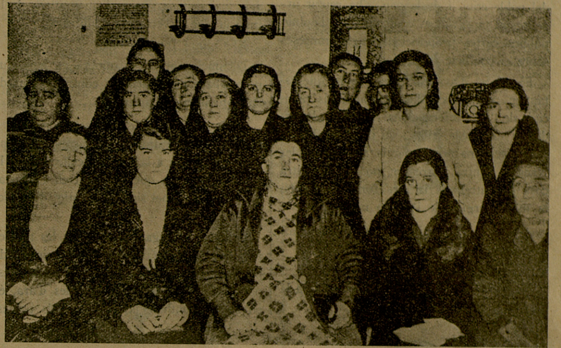
Dones del Comitè de familiars dels presos de Pamplona

Aporteu-los l'escalf de la vostra solidaritat.