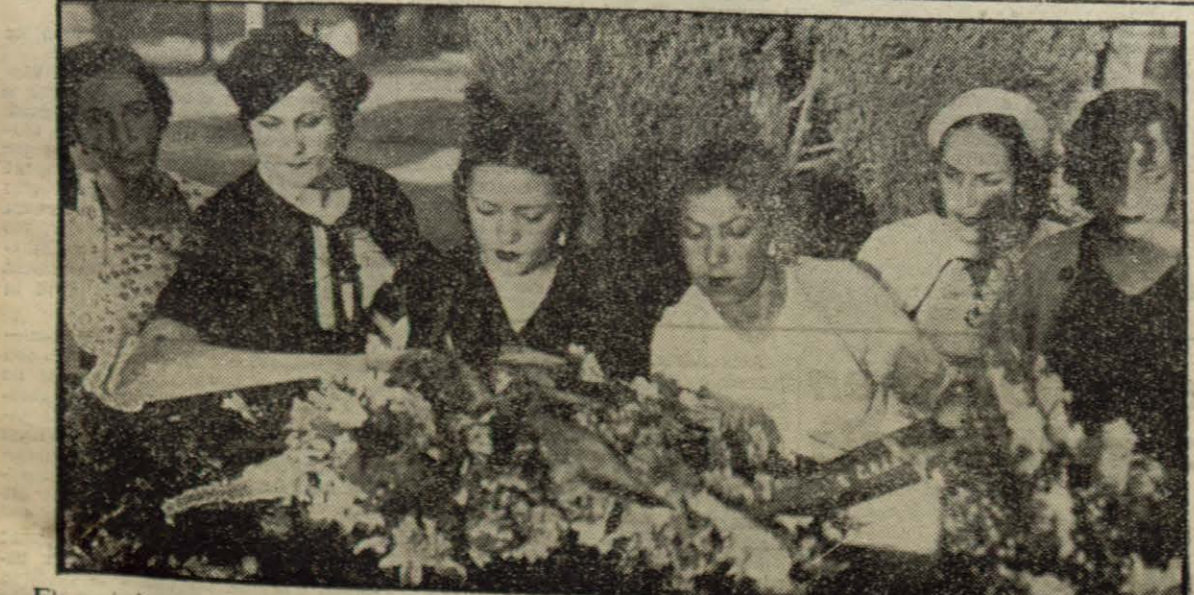
Flors i joventut sobre les cendres del savi. "Dolç sobre dolç", que digué aquella reina de Shakespeare: les estudiants madrilenyes de Medicina homenatjaren ahir la tomba de Ramon i Cajal, en fer un any que és mort

«The Times» diu que la pregunta del senyor Laval de si el Govern anglès reduiria els seus efectius navals a la Mediterrània si Itàlia s'anticipa a retirar els rectoris de tropes que ha enviat a Líbia, dona a entendre que el senyor Mussolini està desitjós de donar per acabada la perillosa aventura que ha iniciat, talment com altres països que desitjarien veure-la acabada. Afegeix que sembla que hi hagi interès a donar una fàcil impressió de l'existència d'un conflicte entre Itàlia i Anglaterra. «No hi ha res d'això» diu el «Times». «No hi ha cap persona en aquest país que hagi somniat amb una guerra anglo-italiana, tal com alguns estrangers suposen.»