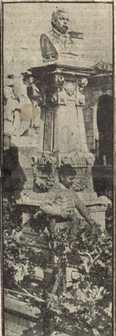
Des de primeres hores del matí d'avui, la tomba de Clavé ha començat a rebre l'homenatge del poble (Cenelles)