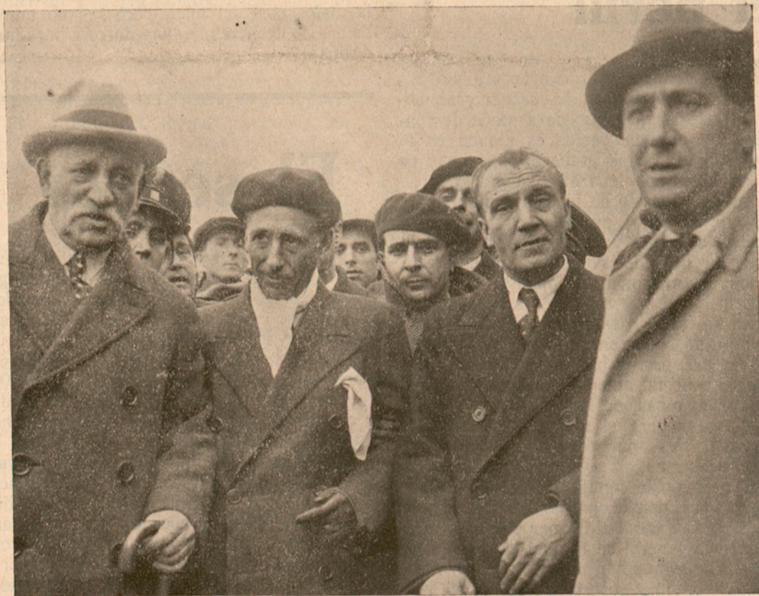
Companys després de baixar del tren a Castelldefels.

Visca la Confederació de Repúbliques Ibèriques!