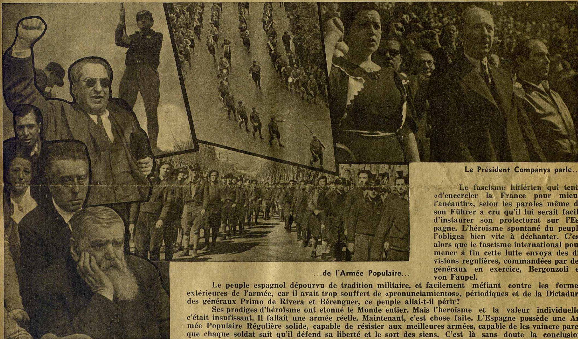
Le Président Companys parle...

Le fascisme hitlérien qui tente «d'encercler la France pour mieux l'anéantir», selon les paroles même de son Führer a cru qu'il lui serait facile d'instaurer son protectorat sur l'Espagne. L'héroïsme spontané du peuple l'obligea bien vite à déchanter. C'est alors que le fascisme international pour mener à fin cette lutte envoya des divisions régulières, commandées par des généraux en exercice, Bergonzoli et von Faupel.