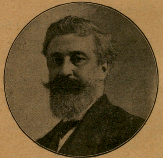
DON SANTIAGO RUSIÑOL

Eximí poeta, guanyador de l'Englantina en els Jocs Florals d'enguany amb ses poesies Flors de Sang .