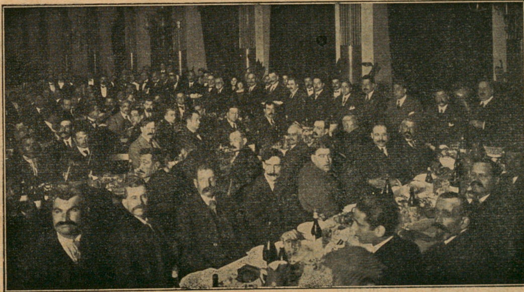
ASPECTE DE LA SALA DEL MUNDIAL PALACE DURANT EL BANQUET DE LA VICTORIA CELEBRAT PEL PARTIT RADICAL

Diguè que el Partit Radical s'encamina a esser l'única i verdadera encarnació del sentit lliberal d'Espanya i recordant una