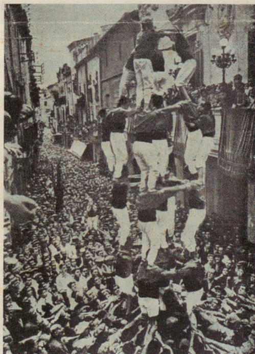
"Els braus Xiqueus de Valls" — que cantà J. Anselm Clavé.

La preparació d'aquesta part, representativa del sentit pràctic que dona fama als catalans i que tant ha contribuït a la prosperitat de Catalunya, correspon als més vells i als casats que els representen com a caps de casa. Aquests procuren que no manquin carn i aviram, les viandes i fruites del temps i el bon vi. Bona estona abans de l'àpat, posaran a refrescar el porró i les ampolles de les begudes amb la fruita que colliran en propi hort o adquiriran dels de la contrada, en un gros cubell ple d'aigua gelada del pou, aigua que tenen cura de renovar degudament. Però aquestes obligacions no els impedeixen d'assistir als actes públics on la seva presència es requereixi: descobrir una placa que