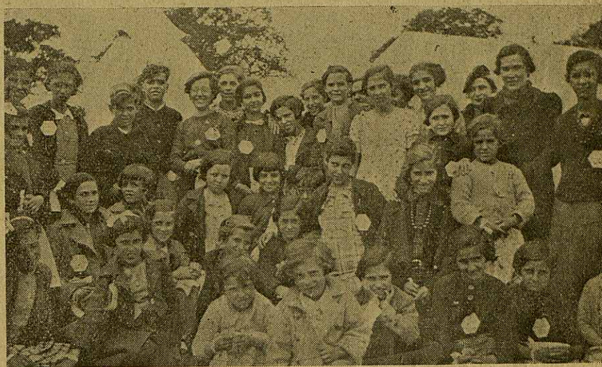
Este otro grabado representa también otro grupo de refugiados eúskaros procedentes de Bilbao. En estos momentos se les ve un tanto optimistas aun dentro de la trágica situación en que se encuentran por haber podido salvar sus vidas de la aviación fascista. ¡Cuántas víctimas inocentes habrán caído en la evacuación realizada hacia Santander! ¿Hasta cuándo va a durar el crimen del fascio?