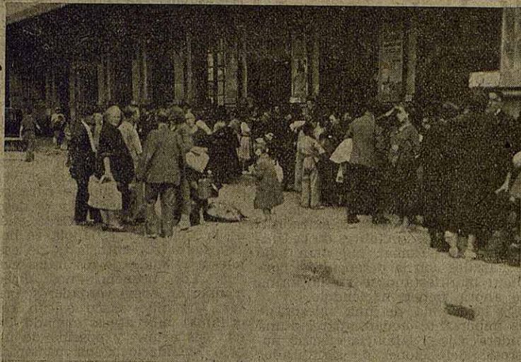
El dolor lancinante de la tragedia pasada, la angustia amenazadora de la invasión, la amargura del éxodo patético, el sufrimiento por cuanto se ha dejado en el Norte y Euzkadi, se mitigan al recibir el fraternal abrazo de cuantos velan en Cataluña por los refugiados.