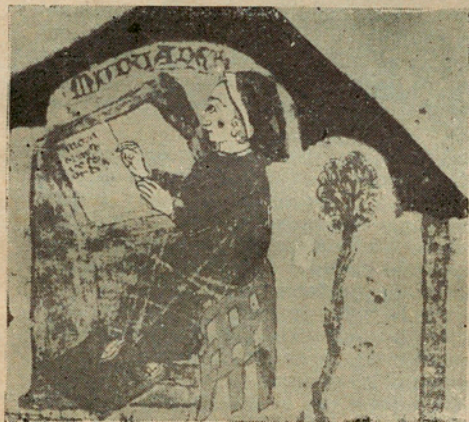
Muntaner escrivint la "Crònica" en la seva tenda de campanya (Segons una miniatura medieval)

Muntaner es planyia de la tendència disgregadora dels catalans. Els joncs—deia—d'un en un són romputs, però en manat resisteixen la mà més poderosa. Han passat segles, i aquella tendència disgregadora ha acabat, no ja amb aquell ample Imperi català, sinó amb la mateixa Nació catalana. Quatre distints Estats se la tenen avui repartida 1) ; dels quals, només la petita Andorra és una pàtria lliure de lliures catalans. A Espanya correspon el més gros bocí: prop d'una quarta part dels seus súbdits parlen el català. D'aquí, l'interès dels castellans a fomentar la nostra tendència disgregadora; car, si forméssim el manat de Muntaner, junts fariem, gràcies a la nostra força, la nostra voluntat. L'interès castellà ha estat excel·lentment servit per l'esperit migradament "regionalista" de la regió de Barcelona; el qual tendia a considerar estrangers tots els qui parlen una variant del nostre idioma distinta de la seva, i lluny de voler reconstituir la Nació dels Catalans, Valencians i Balears amb un ample territori i un exèrcit per a defensar-lo, arribava, en la seva forma més radical, a propugnar la separació de les províncies de Barcelona, Tarragona, Lleida i Girona de la resta dels països que parlen la llengua de Lull, Muntaner i Auziàs March.