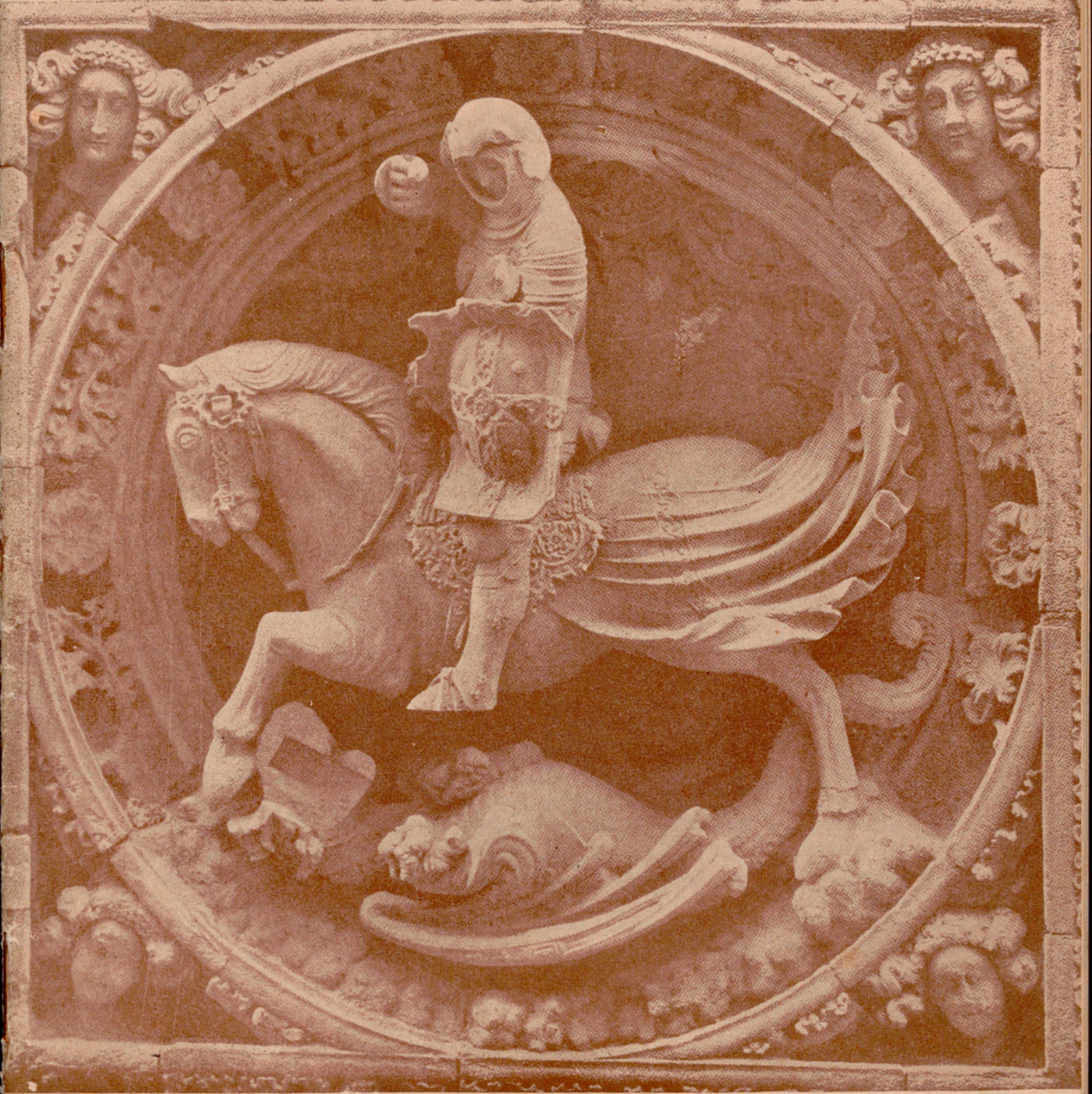
San Jorge. Año 1418. Fachada de la Generalidad de Cataluña.