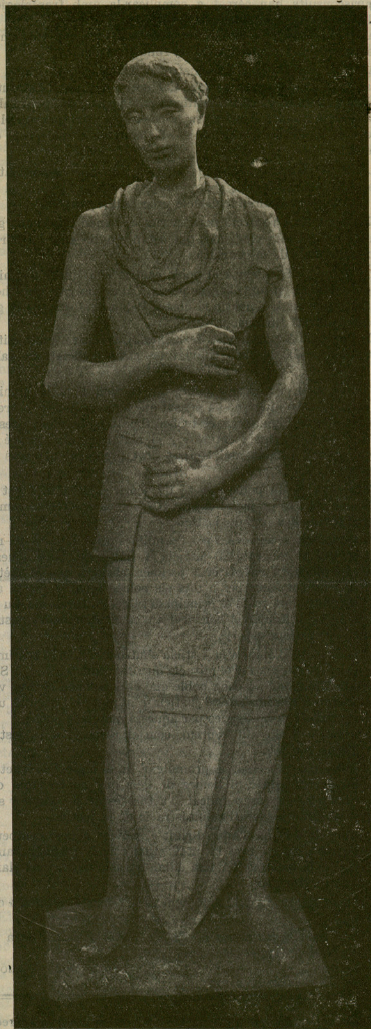
ELS ARTISTES CATALANS D'ARA SANT JORDI Escultura de Joan Rebull