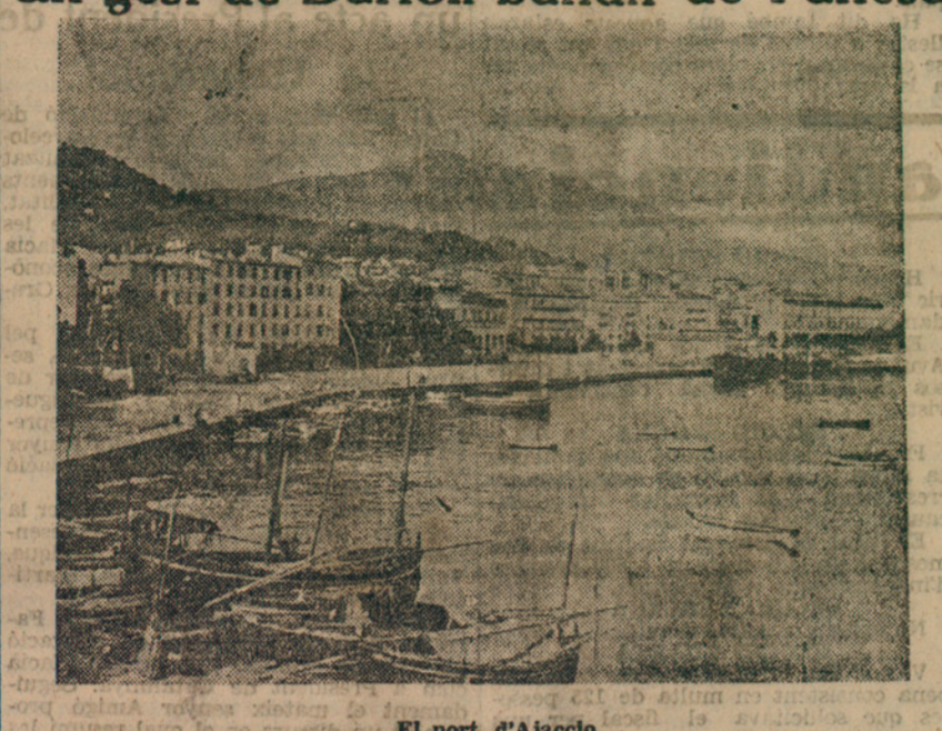
El port d'Ajaccio