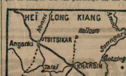
Volants de Tsitikar, ciutat presa pels japonesos

Tots els que han oït a la "Senyoreta Doctor", tenien la impressió ben neta que ella estava disposada, malgrat tot, a... tornar començar.