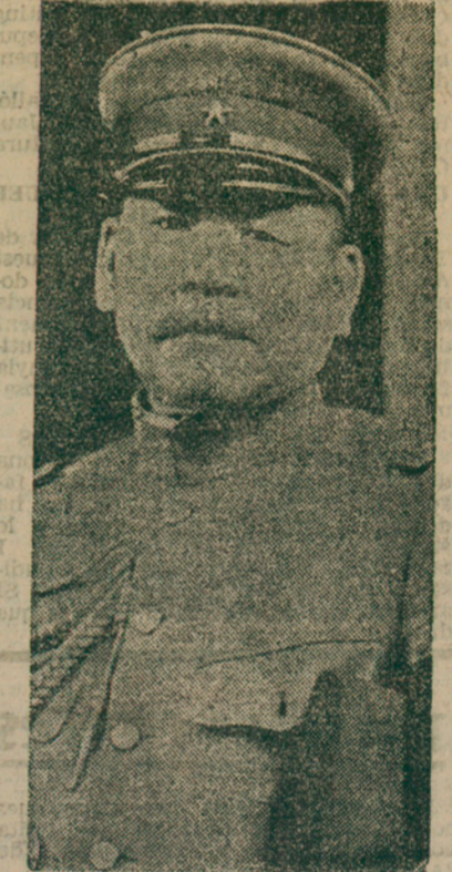
El general Hiro Minami, ministre de la Guerra, del Japó

A la S. de N. continua l'incertitud i no hi ha la més petita base on fonamentar una esperança d'arranjament