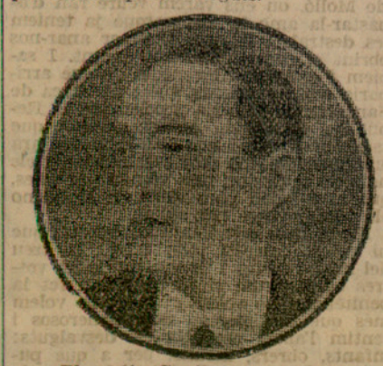
El comte Condanhove-Calergi

Per al premi de la Pau, corresponent als premis Nobel, d'aquest any, nombroses personalitats llatines, representants a diferents països, proposen al comte Condanhove Calergi, els treballs del qual a favor de la pau universal són per tothom prou coneguts.