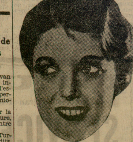
L'artista de cinema Loretta Young que les seves pestanyes — que un jurat d'experts en bellesa femenina ha calificat de les més formoses d'Amèrica — valen 500.000 dòlars. I per aquesta suma Loretta Young les ha assegurades a una casa neoyorkina.

L'ambaixadora de la capital fou, després de l'elecció, presentada al públic. Es produí aleshores una decepció i una viva manifestació de protesta contra la decisió del jurat. El públic aclamà dues candidates derrotades, que foren portades en triomf, en tant que la dimissió de l'elegida era sorollosament, però venament reclamada. Els guàrdies hagueren d'intervenir energicament i fou necessari evacuar la sala del music-hall on tingué lloc l'elecció.