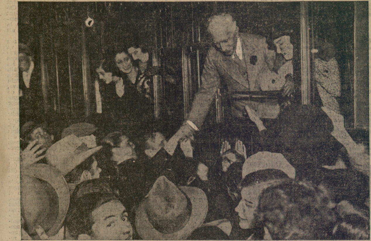
L'acomiadament afectuós del poble de Barcelona al senyor Macià

tren triga en marxar. Francesc Macià, contestant amablement totes les preguntes que li adrejava el poble.