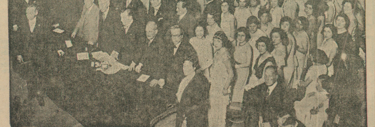
El senyor Macià presidint l'acte celebrat a l'Orfeo Gracienc, amb motiu de les seves noces d'argent.

Amb gran solemnitat l'Orfeo Gracienc va celebrar el dissabte, a la nit, en el seu local social, els seus vint-i-cinc anys de vida. Aquesta festa veu d'haver-se celebrat l'any 1929, però la Dictadura no ho permeté.