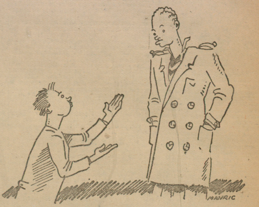
—He entrat de meritori. Per ara no em doneu res. Però l'amo diu que el mes entrant em doblaran el sou...

La policia, la qual, com hem dit, no es dona repòs per tal de descobrir aquest crim, detingué, a darrera hora de la tarda, una dona d'edat, a Granollers, la qual, segons les nostres notícies, és la mare de la dona de més edat que la interfecta i que havia estat vista diverses vegades a la casa on es va cometre el crim, i que en sortí el dia següent de perpetrar-se amb el llogater de la casa, o sigui el fals Martínez. La detinguda ha ingressat als calabossos de la Prefectura de Policia, on interrogada ha donat algunes explicacions als agents, els quals l'han detingut en qualitat d'incomunicada, i han sortit novament cap a la veïna població, per a ampliar unes diligències que es conceptuen interessants. Sembla que hom cerca la filla de la