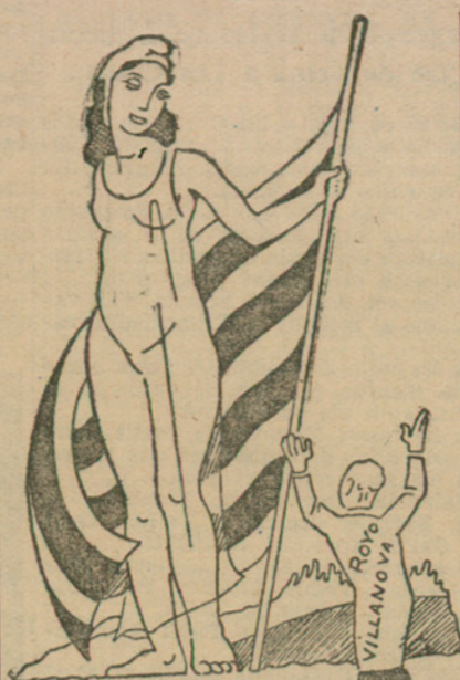
—Ets molt petit, però serà qüestió de vigilar-te!