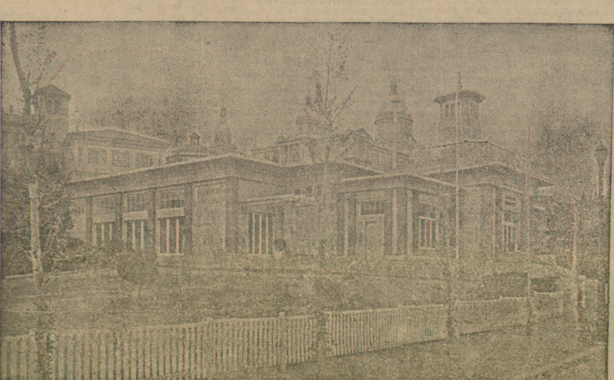
El bell edifici del "Parvulari Forestier", situat als jardins de Montjuïc, que demà s'inaugurarà solemniament