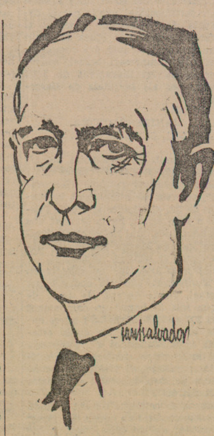
M. SMITH, candidat a la presidència dels Estats Units