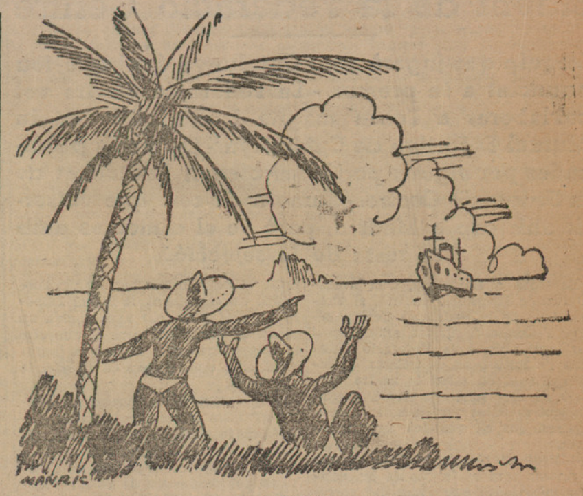
A BATA —Mira. Ara ve un nou vaixell. —Potser ens porti aquells monàrquics que volien cremar una tribuna!

Això espero que no passarà mai més, acadé dient el senyor Sánchez Albornoz, i que Catalunya i Castella, aquests dos grans pobles, més semblants del que ens pensem; els dos pobles dinàmics de la península Ibèrica, que tenen un mateix pòsit de sentimentalisme — i per això és menester una major cura en lurs relacions — trobaran la verdadera tradició hispànica que ha restat trencada des del segle XVI.