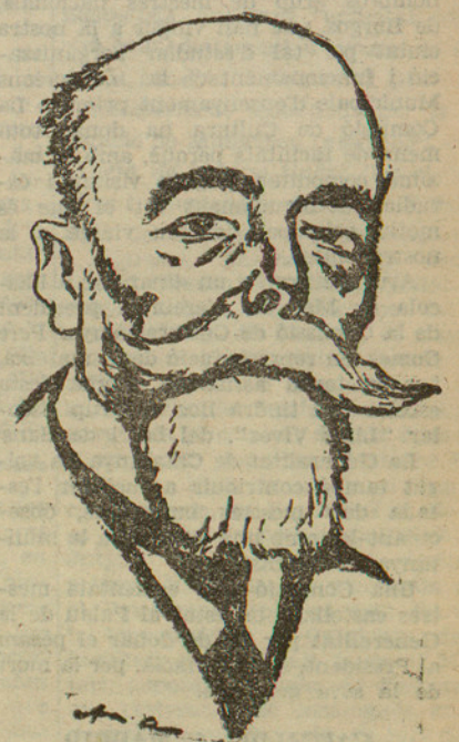
M. PAUL DOUMER

A l'any 1895 i després d'haver estat elegit altres vegades al Parlament se li va confiar la cartera d'Hisenda, amb el Ministeri Bourgeois.