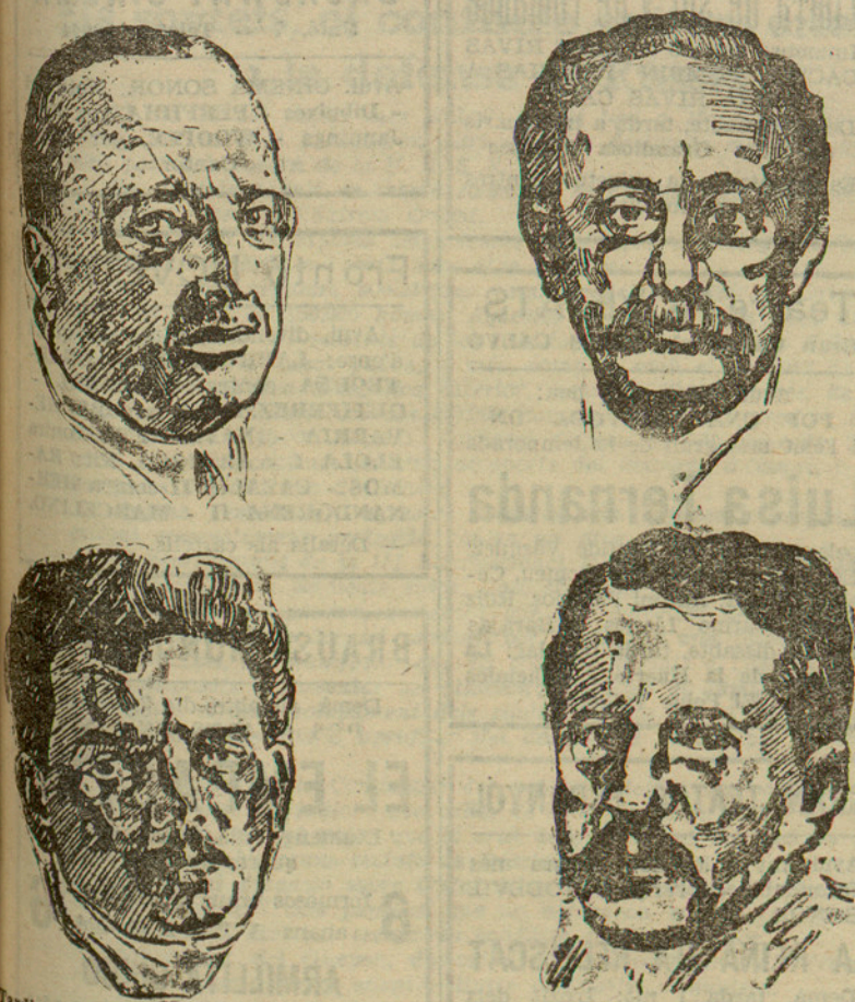
Tardieu, Blum, Herriot, Cachin... Heus aci les figures de màxima actualitat política a França, a la vetlla del segon torn d'escrutini