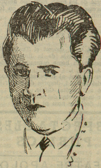
El metge rus Gorguloff, autor de l'atemptat contra el president de la República francesa

"La Humanité", òrgan comunista francès, ha publicat un extraordinari atribuït l'atemptat als russos blancs, als quals omple d'improperis. Aquest periòdic insereix una informació so-