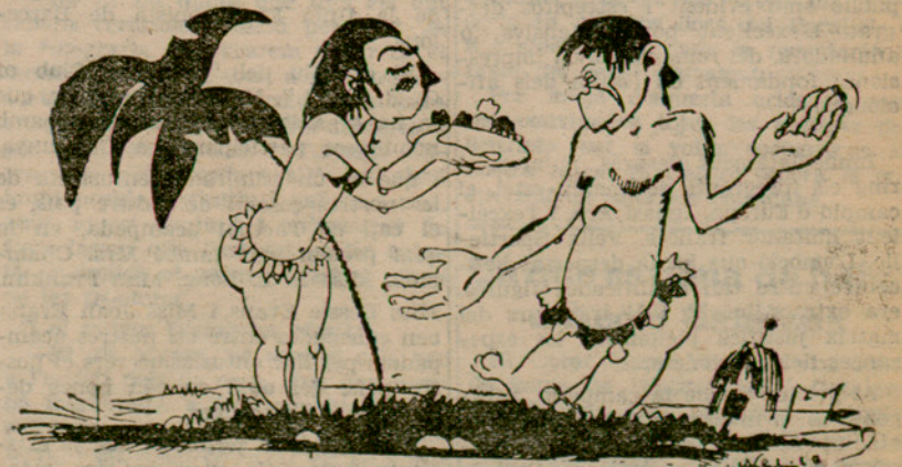
ADAM A EVA

—Vàrem ésser uns tontos de no exigir la Reforma Agrària.