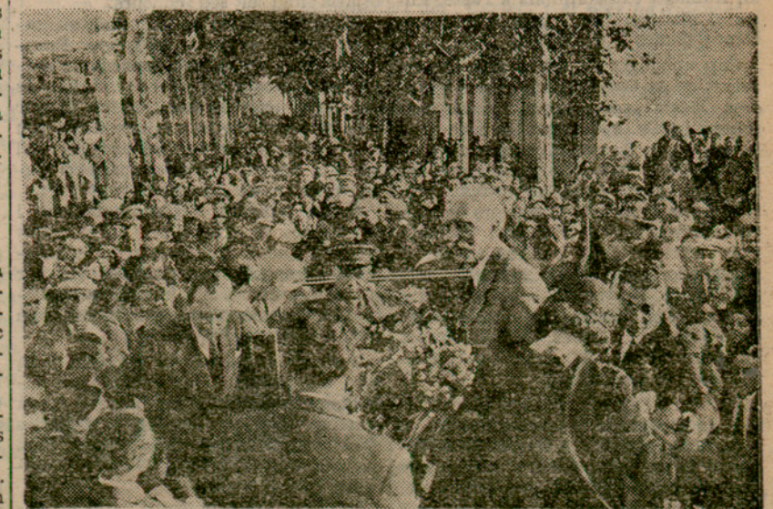
El poble de Roda tributa una entusiasta rebuda al senyor Macià

Entre la gentada, hi havia un centenar de noies amb llagades catalanes damunt del pit, i de tricolors republicanes que els lligaven els cabells. En mig del grup de noies, s'excavaven uns cartells que deien: "Demanem el respecte moral i material pels nostres