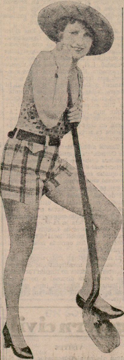
La cèlebre artista cinematogràfica Anita Page, que ha batut el rècord dels honoraris, a Hollywood. Cobra 1.900 dòlars per setmana...

El 15 de juny ja estarà ilet i navegarem immediatament.