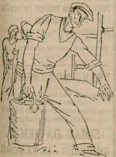
— El Sant Pare diu que només a l'Església trobarem remei als nostres mals... I ara, l'Església ens demana quartos!

Sembla que aquest tenor és el cèlebre Campagnola.