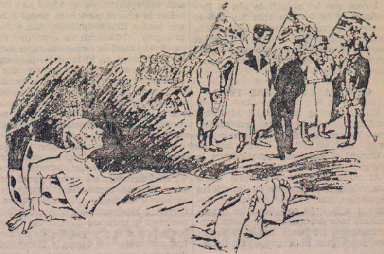
El despertar d'Alemanya. —Voleu jugar que encara estic en el mateix somni de 1914?

El dissabte morí. Ha mort! Vosaltres, amics de Girona, sabeu el gran dolor que hi ha en aquesta paraula. Un dolor amb ganes de dir un reneç.