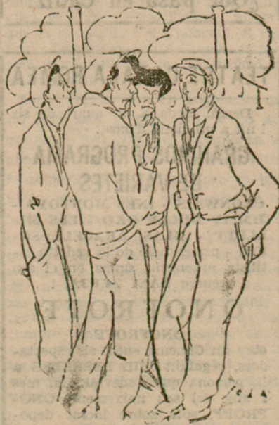
—Ja has vist "La Patum"? —Prou que en vaig veure en temps de la dictadura!

¡Y así nuestra España será más feliz!... (¡Aunque no lo entienda García Sanchiz!)"