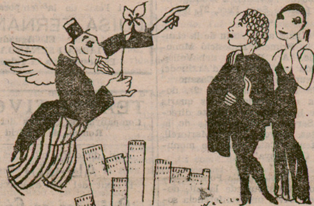
L'ONCLE SAM NO ESTA PER DONES FATALS

Les hores de set de la tarda i dos quarts de dotze de la nit no sols són les “millors i més saludables per a dormir”, sinó que demés són suficients per al descans d'una persona que fa una vida de gran activitat.