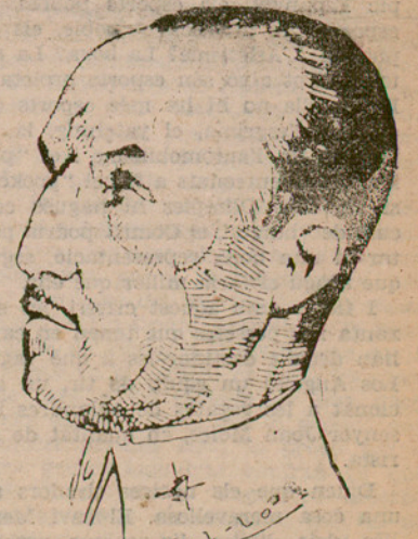
El general Goded, la figura del qual aquests dies ha tingut grossa actualitat

També ha anunciat que escriurà la història del Nil, que continuarà les impressions del seu viatge a Abissínia.